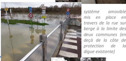
système amovible mis en place en travers de la rue sur berge à la limite des deux communes (en deçà de la côte de protection de la digue existante)